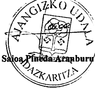
Saioa Pineda Aranburu